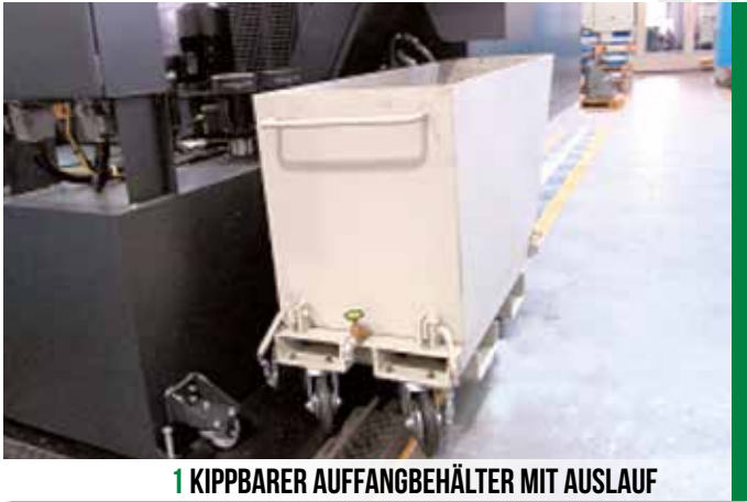
1 KIPPBARER AUFFANGBEHÄLTER MIT AUSLAUF

Die Vielfalt der anfallenden Späne erfordert bei der Erfassung, insbesondere wegen der unterschiedlichen Feuchtigkeitsgehalte, entsprechend angepasste Methoden. Diese orientieren sich außerdem an der Menge der anfallenden Späne in einem Unternehmen (vgl. hierzu auch Kapitel 4.3).