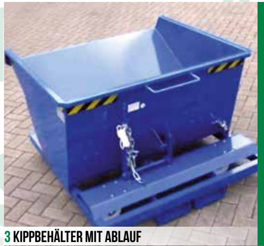
3 KIPPBEHÄLTER MIT ABLAUF