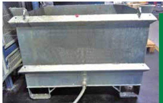
4 AUFFANGCONTAINER MIT DOPPELWANDIGEM BODEN, SPÄNESIEB UND ABLASSVORRICHTUNG FÜR EMULSIONEN

Für das Auffangen der Späne am Ort der Entstehung können beispielsweise Kippbehälter zum Einsatz kommen, die in jeder Größe erhältlich und mit einem Ablaufhahn oder einer Schlauchverbindung zur Rückführung von Emulsionen oder Schneidölen ausgestattet sind, siehe Bild 1 - 4. Es ist verstärkt auf die Dichtigkeit der Container zu achten. Die Doppelwandigkeit des Behälterbodens kann hier unterstützend wirken.